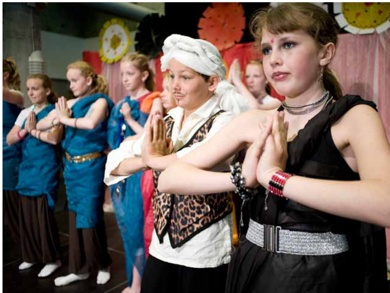
Barnas operafestival