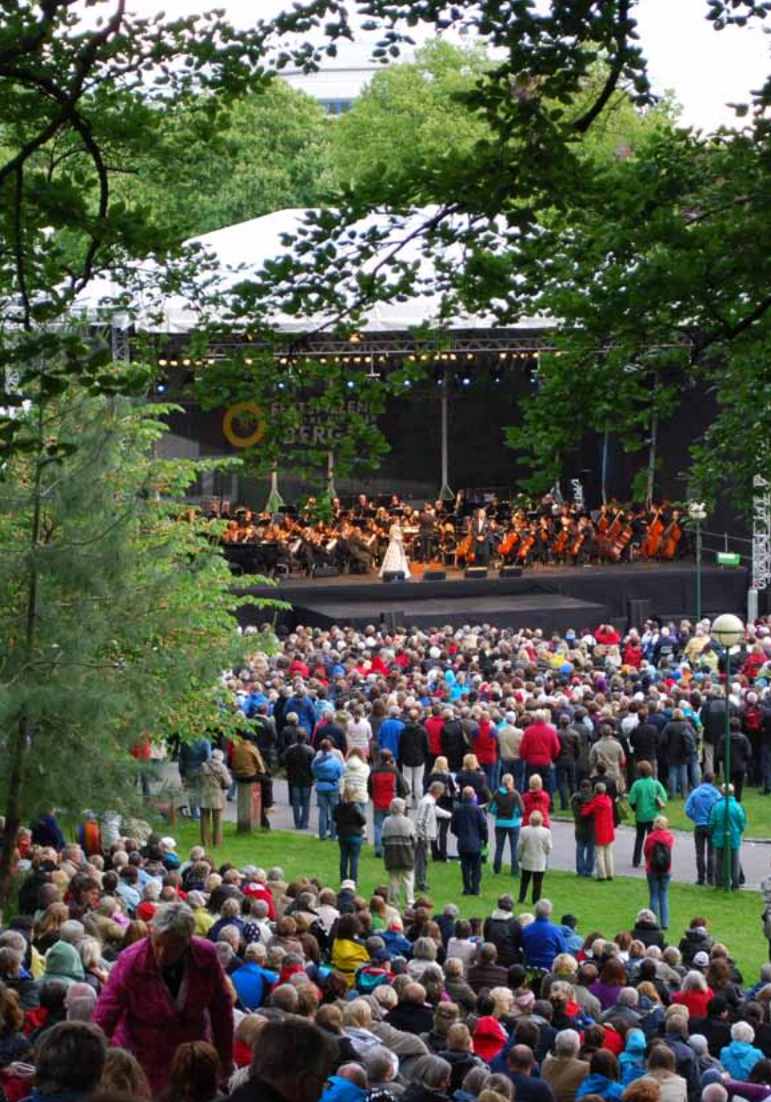
Sissel Kyrkjebø, Bryn Terfel og BFO sjarmerte publikum i Nygårdsparken