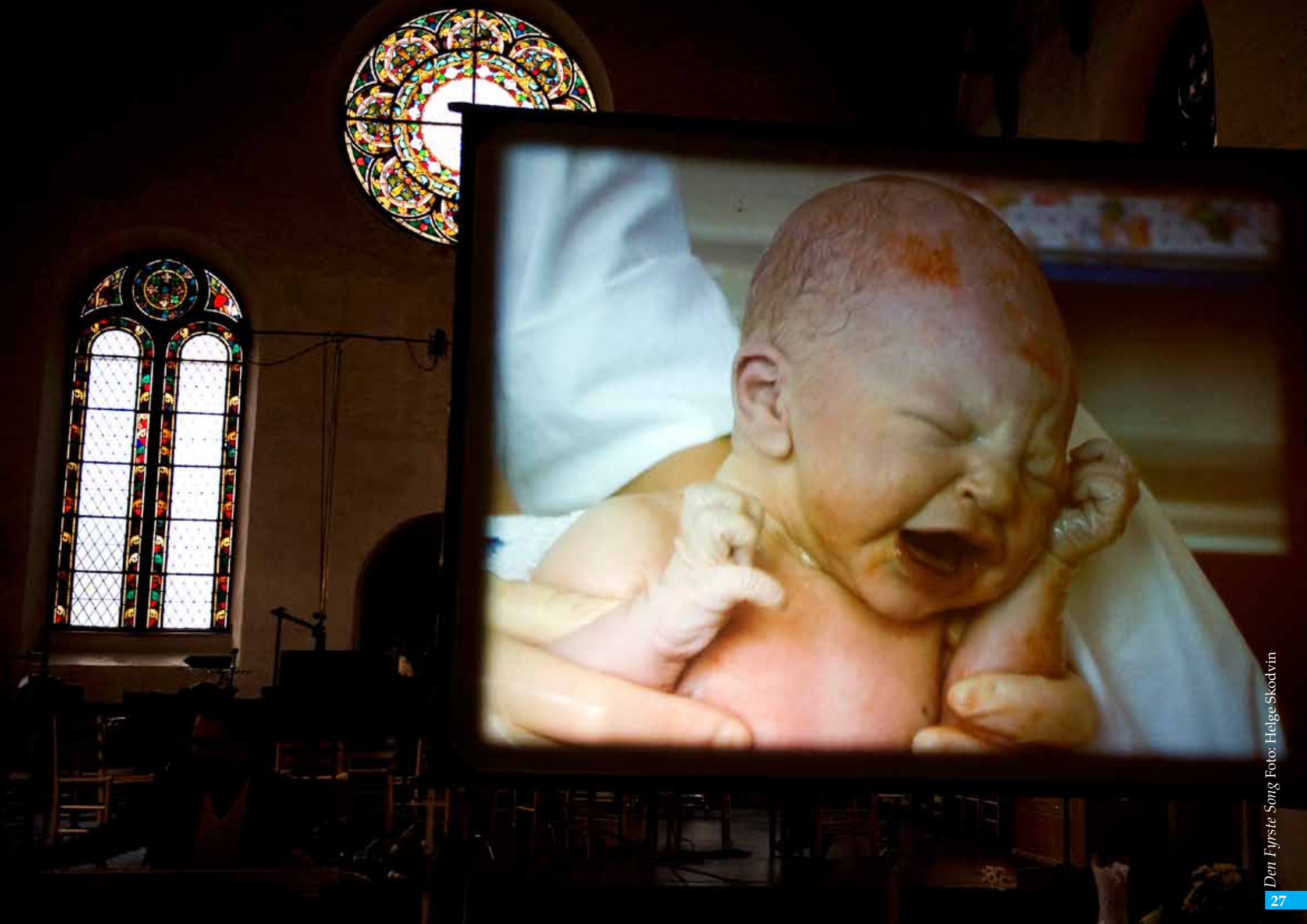
Den Fyrste Song