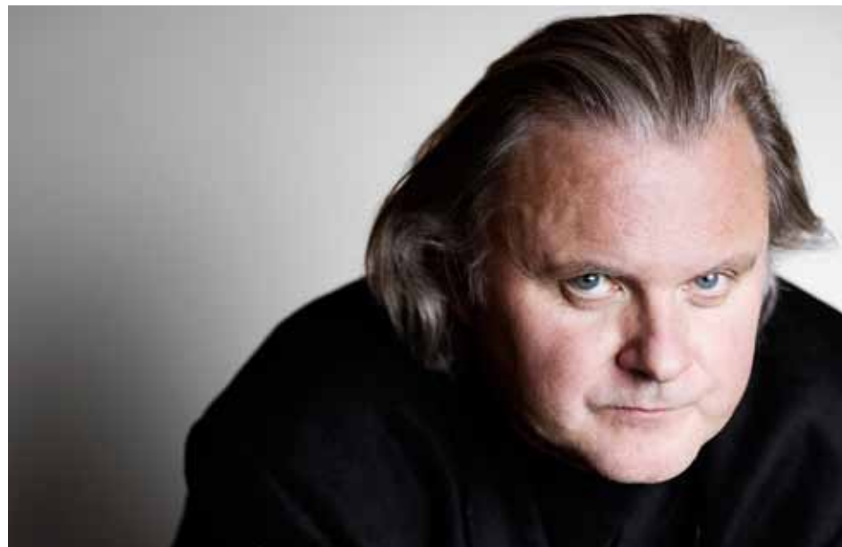
Jon Fosse

Concerto Copenhagen, Det Norske Kammerorkester, barokkorkesteret La Tricotea fra Granada og norske Gjertruds sigøynerorkester holdt også konserter under årets festspill.