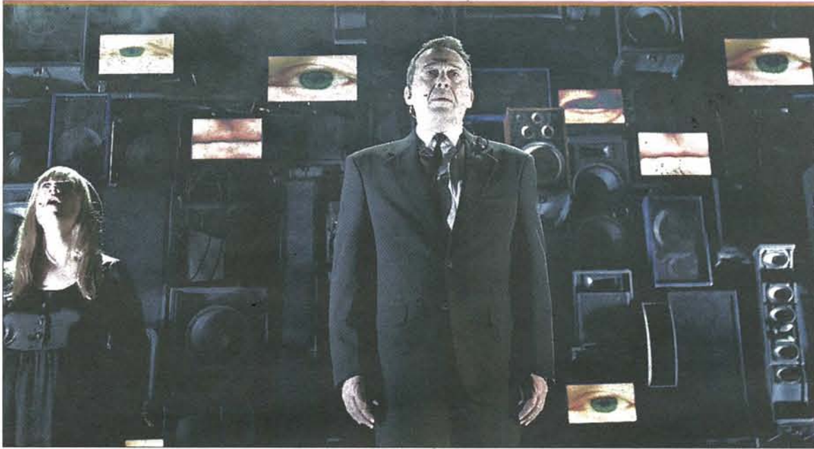
ENSOMHETEN: Teaterforestillingen til Calixto Bieito tydeliggjør den ensomheten mennesker står overfor i møte med smerter, lidelse, ura, angst og død, skriver Jonas Gahr Støre. Bildet er fra forestillingen på DNS.