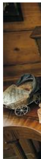
ORIGINAL: Huset på Valestrand