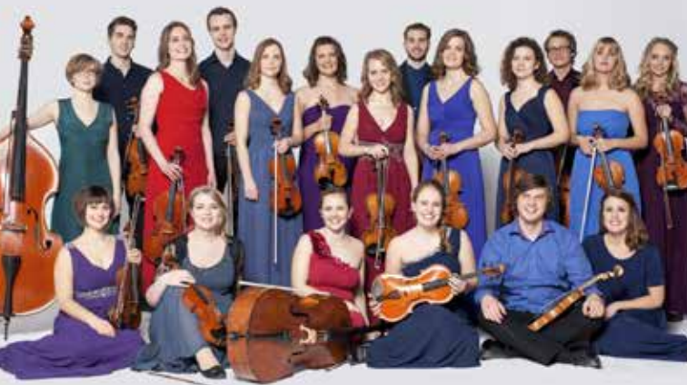
Ensemble Allegria vinner av Statoils Klassiske Musikkstipend 2012