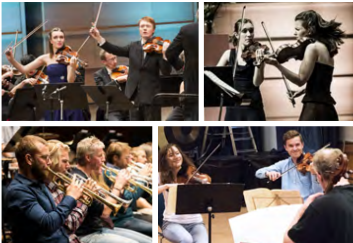
Bilder fra Festspillene i Bergen, Oslo-Filharmonien og Crescendo 2016