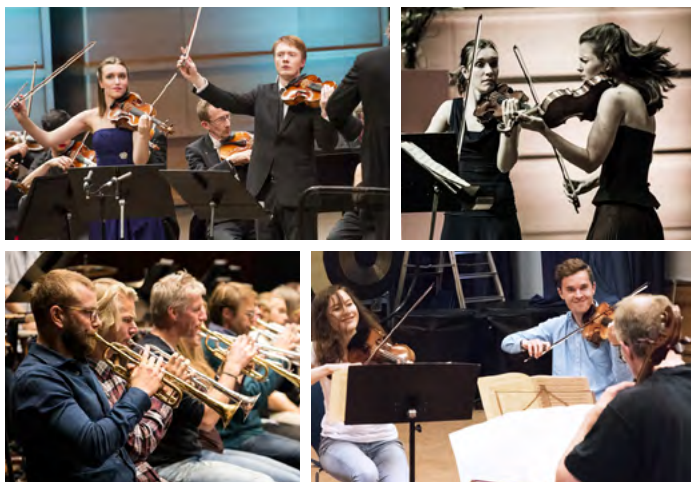
Bilder fra Festspillene i Bergen, Oslo-Filharmonien og Crescendo 2016